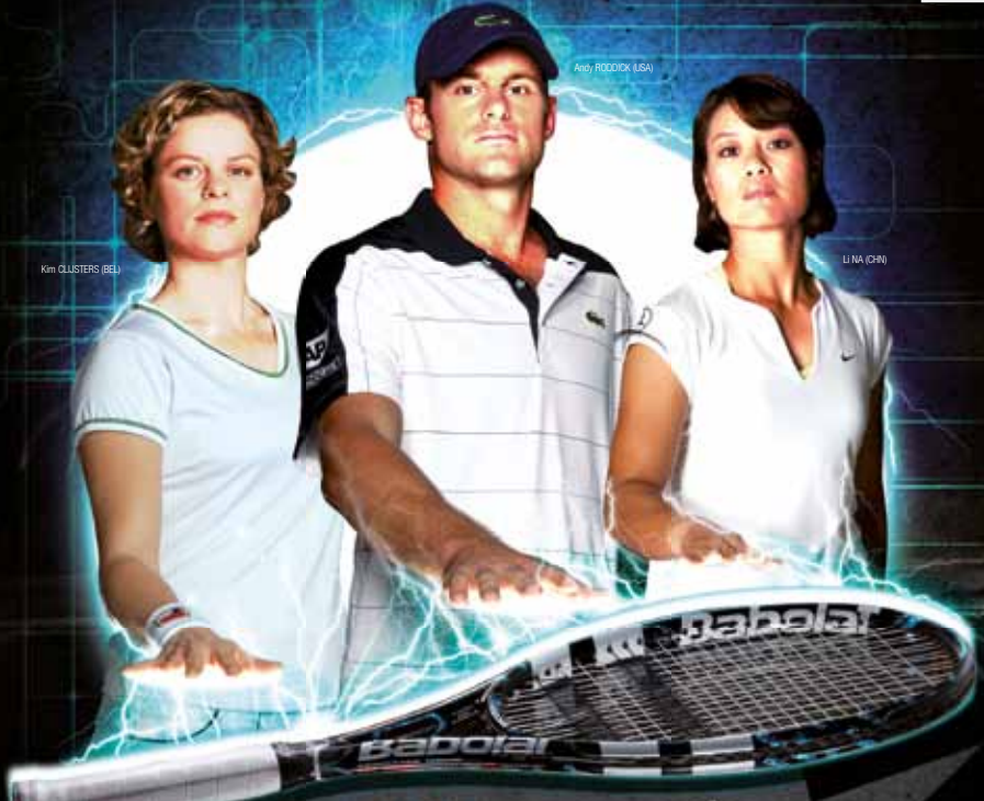
LI NA (CHN)