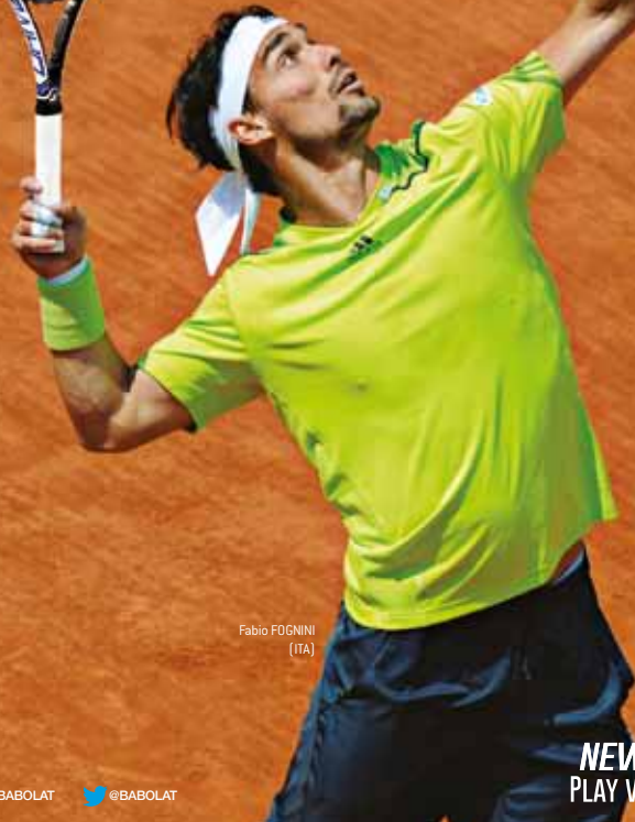
Fabio FOGNINI (ITA)