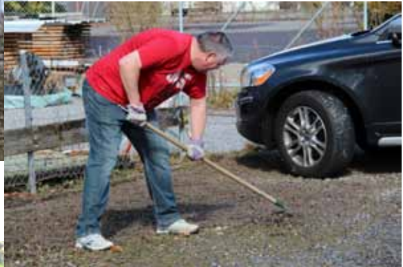
Auf der Anlage wurde

Leider waren die Plätze etwas zu nass, um sie bereits zu bearbeiten. Wir konnten mindesten die Steine sowie die Holzlatte entfernen, damit die Plätze für den 2. Fronddienst bereit sind. Dies hat der guten Stimmung keinen Abbruch getan, und rasch verteilten sich die Freiwilligen auf dem ganzen Areal.